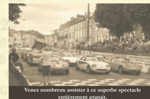
Venez nombreux assister à ce superbe spectacle entièrement gratuit.

Malgré la volonté et l'énergie des organisateurs aucune course ne pourra être autorisée à Bressuire par la Fédération Française du Sport Automobile.