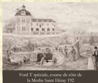
Ford T spéciale, course de côte de la Mothe Saint Héray 192